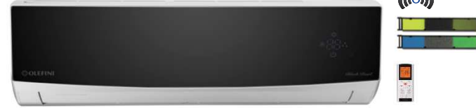
Black Pearl Seri