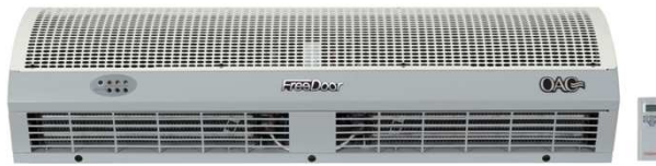
Isıtıcı Hava Perdeleri