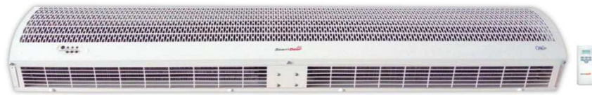
Isıtıcılı Hava Perdeleri