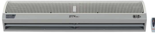
Isıtıcısız Hava Perdeleri

11 - Yetkili servislerin yapmadığı montajlar garanti kapsamı dışında kalacaktır.